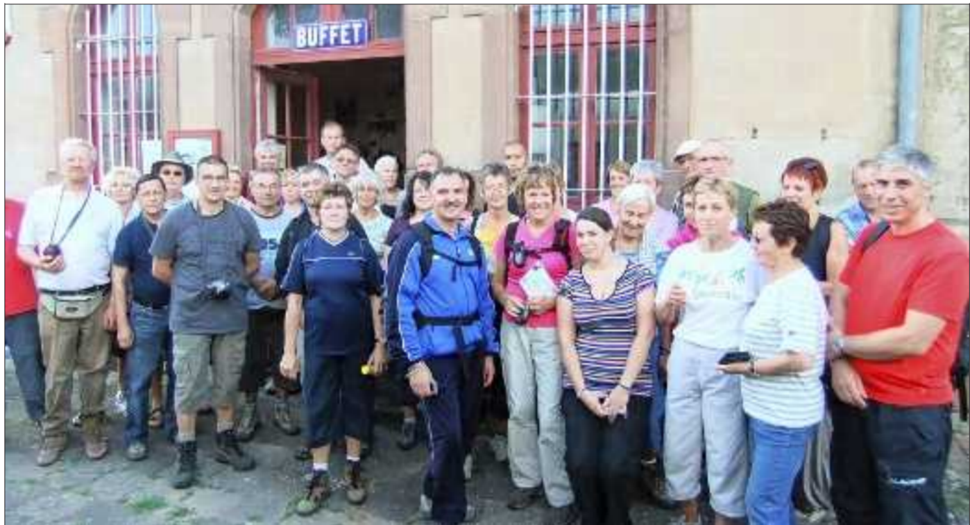
Le groupe réuni à la gare, après la grande marche et avant de remonter dans le train.

Un petit détour pour admirer des gravures rupestres datant des Celtes, à Nonnefeld. Dans