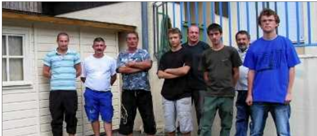
Les jeunes, avec les services techniques, devant le cabanon.

Durant la période des vacances, la municipalité avait recruté des jeunes du village, pour leur offrir un job d'été sur une période de trois semaines pour participer aux travaux de la commune.