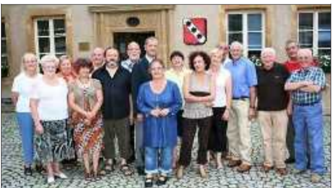
Le jury du concours des maisons fleuries et du patrimoine réuni en mairie d'Ennery.