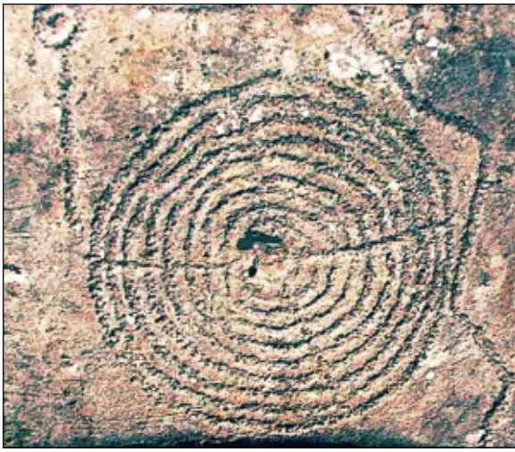
Gravure rupestre grotte de Carschenna (Suisse) Robert Delaunay "Football" 1916