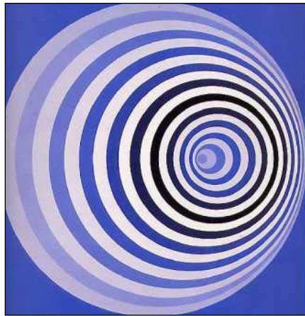
Victor Vasarely Marcel Duchamp "Rotoreliefs" Kitaoka illusion optique