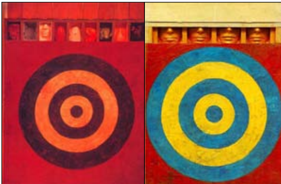
Asger Johns Target with four faces 1955 Asger Johns Target with Plaster Casts 1955

Imaginez maintenant que sur l'eau on mette un bouchon à flotter. Le passage de la vague va le faire monter et descendre alternativement. On appelle fréquence le nombre d'aller-retour qu'il fait pendant une seconde. La fréquence s'exprime en Hertz. Plus les aller-retours du bouchon sont rapides, plus la fréquence est grande.